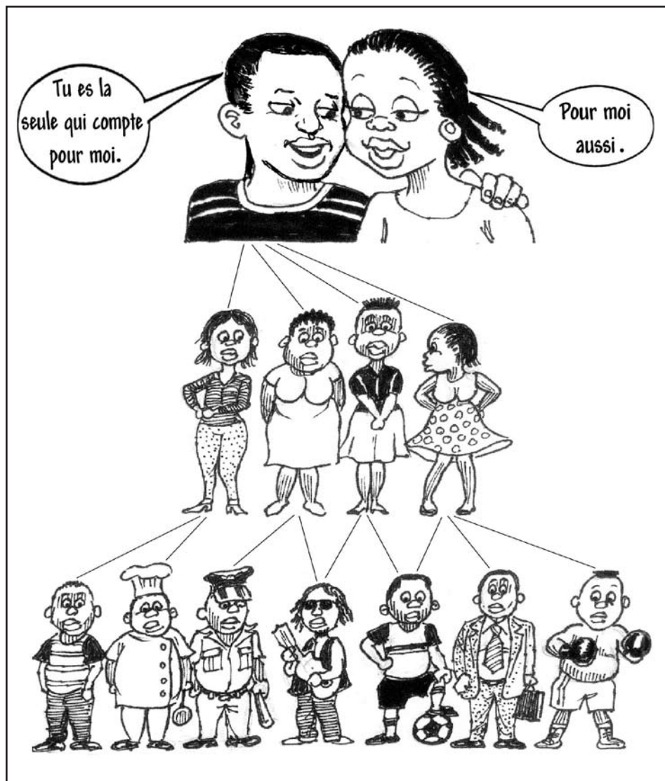
Réseaux sexuels : comment le VIH se transmet rapidement dans une population.

On s'attend, et c'est le cas dans de nombreux pays, à ce qu'un homme ait plusieurs partenaires sexuels, mais qu'une femme n'ait de rapports qu'avec son mari. Dans certains pays, le sort d'une femme qui a un partenaire en dehors du mariage peut être le divorce, le rejet par la société ou même l'assassinat - mais si un homme agit de même il n'est pas puni. Est-ce que votre société a cette attitude de deux poids, deux mesures ? Si oui, c'est probablement un facteur dans la propagation du VIH.