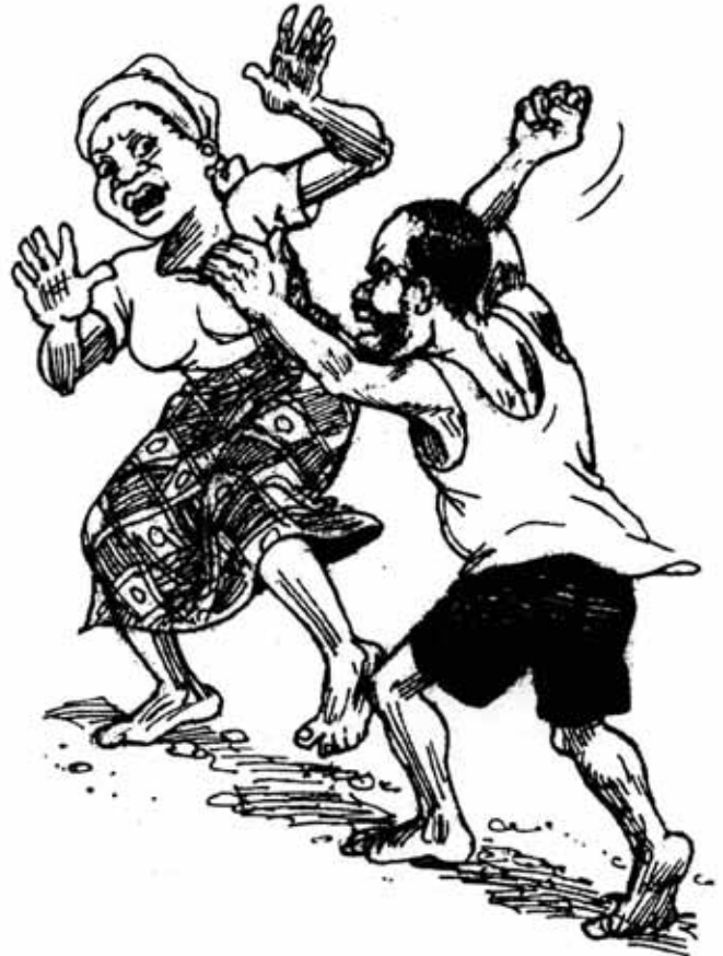
Katika warsha za maisha ya familia nchini Malawi na Zambia wanawake walisema kwamba wanaogopa vipigo vya waume wao.