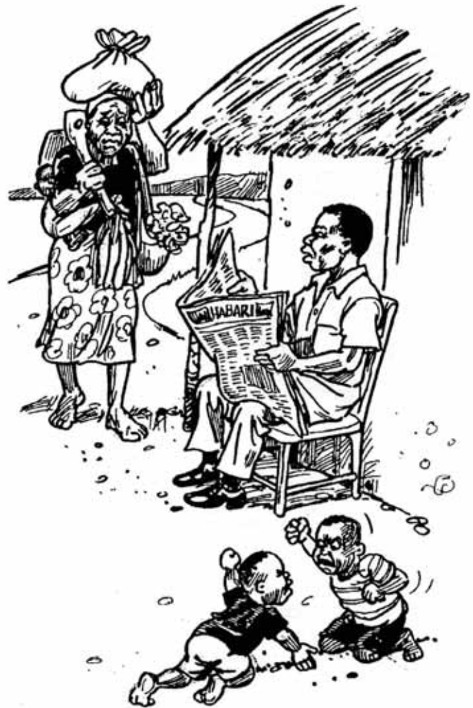
KWANINI UMECHELEWA NA KWA NINI CHAKULA HAKIJAWA TAYARI