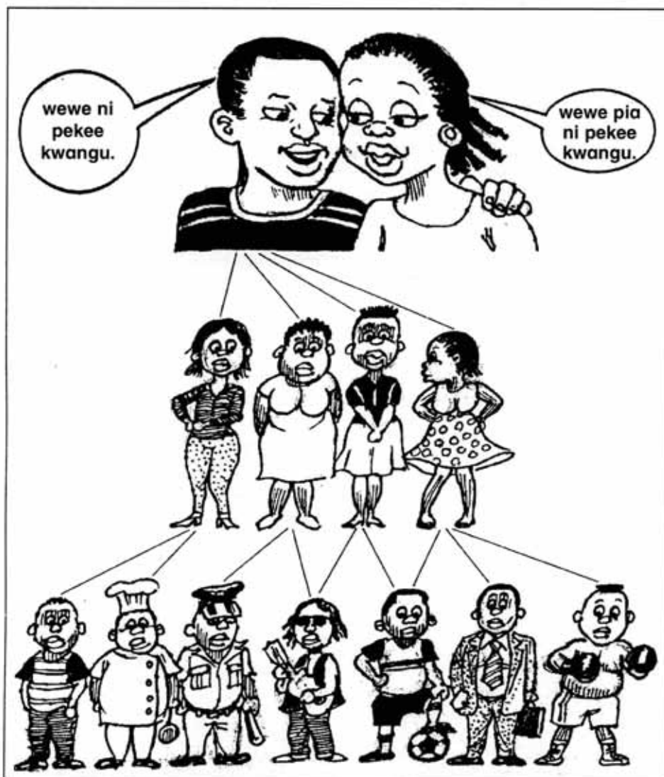
Mitandao ya kingono: Namna VVU vinavyoenea haraka katika jamii

Katika nchi nyingi wanaume, wanatarajiwa kuwa na wapenzi wengi, lakini wanawake wanatarajiwa walale na waume wao tu. Katika baadhi ya sehemu za dunia, mwanamke anayechukua mpenzi nje ya ndoa, anaweza kutalikiwa, kutengwa na jamii au hata kuuawa – lakini mwanamke anayefanya hivyo, haadhibiwi. Je, tabia hii ya upendeleo ipo katika jamii yako? Kama ipo, pengine inachangia kuenea kwa VVU.