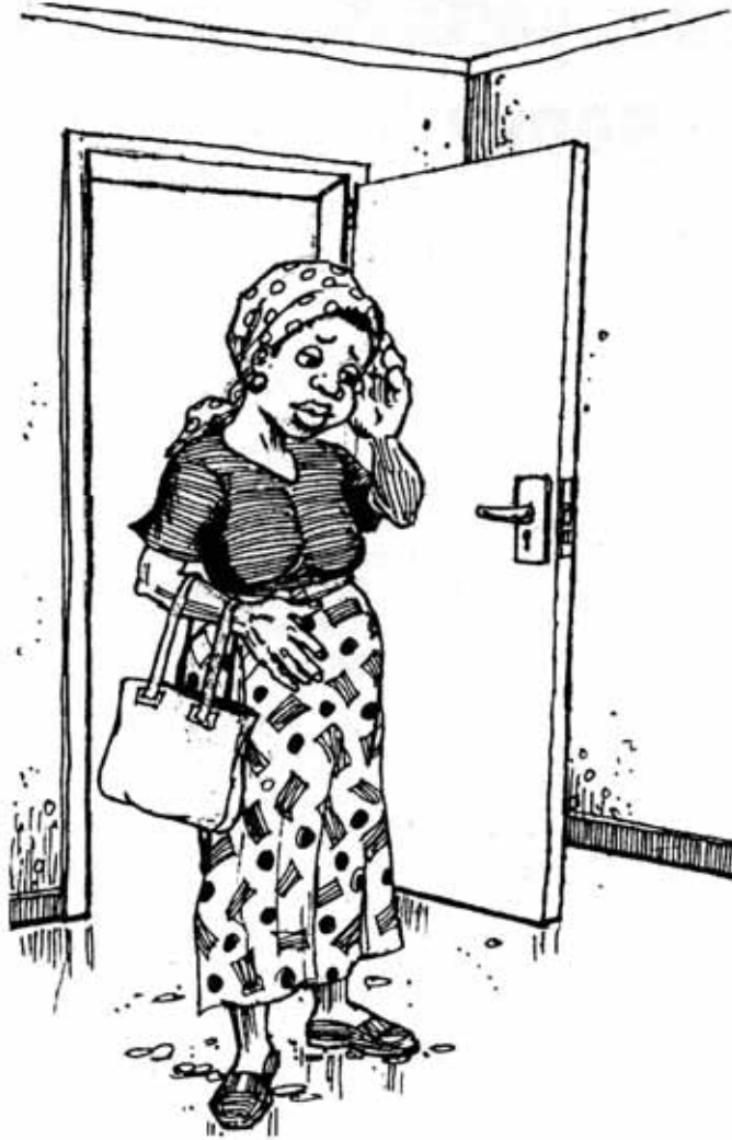
Igizo dhima: Mke anagundua kwamba ana VVU katika mimba yake ya kwanza.